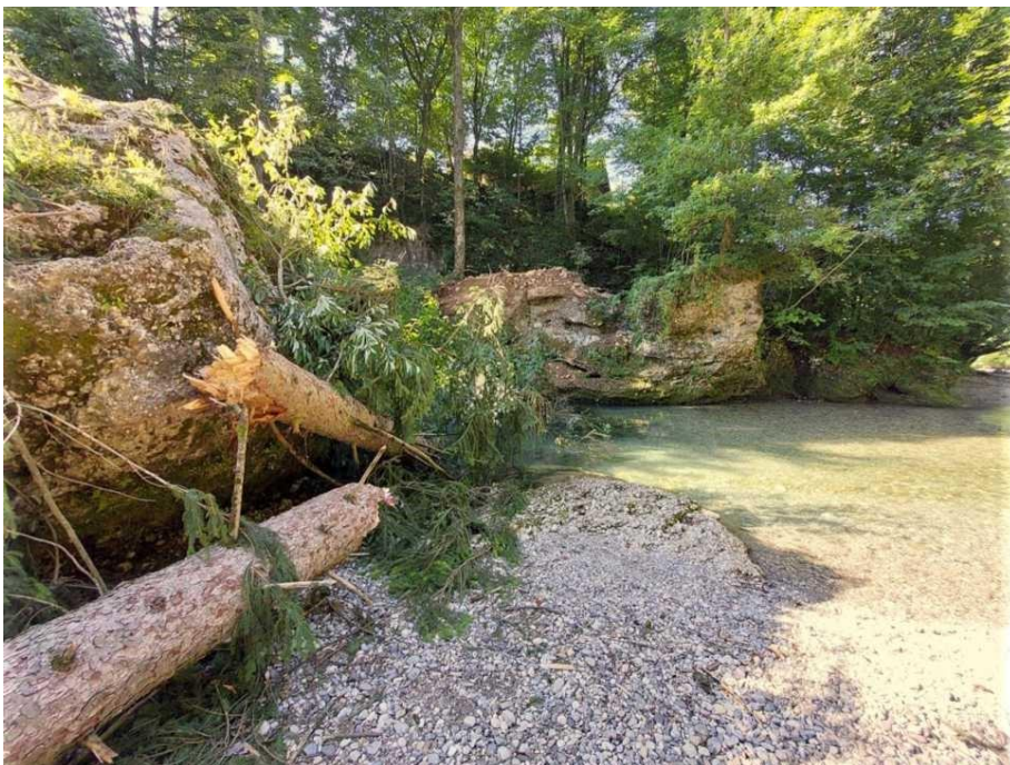
Fotografiji podrte smreke v strugi Kokre, ki zapira pretočni profil Kokre.