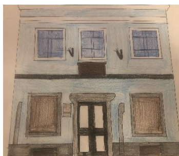
Emilija Borkovič, 8. b