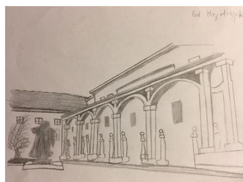
Gal Hajdinjak, 9. b