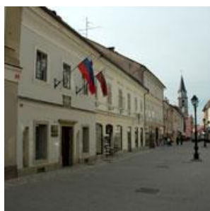
Prešernova hiša Kranj

https://www.gorenjski-muzej.si/lokacije/presernova-hisa/