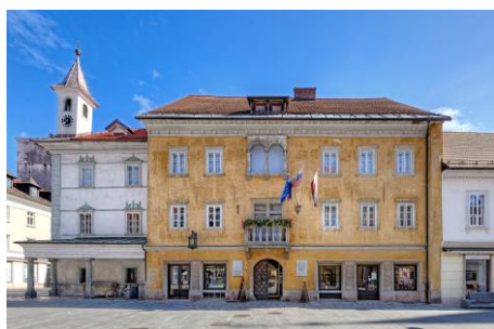
Mestna hiša Kranj

https://www.gorenjski-muzej.si/lokacije/presernova-hisa/