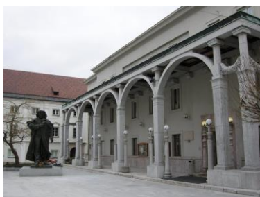
Prešernovo gledališče Kranj