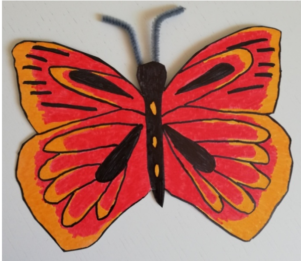
ALJAŽ FAJFAR, 7. B