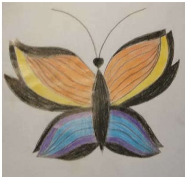
MAŠA GOLOB, 7. B