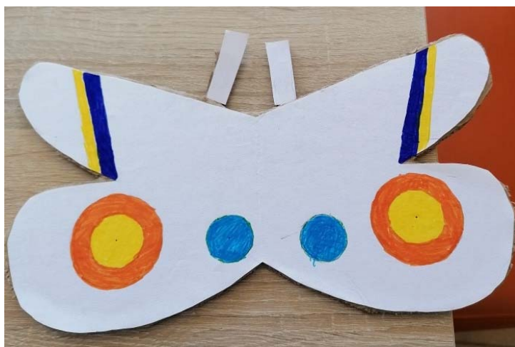
HRISTIЈAN RISTOV, 7. B