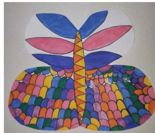
EMILIA BORKOVIĆ, 7. B