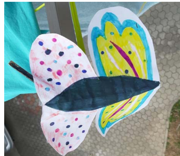
NIK SEVER, 7. B