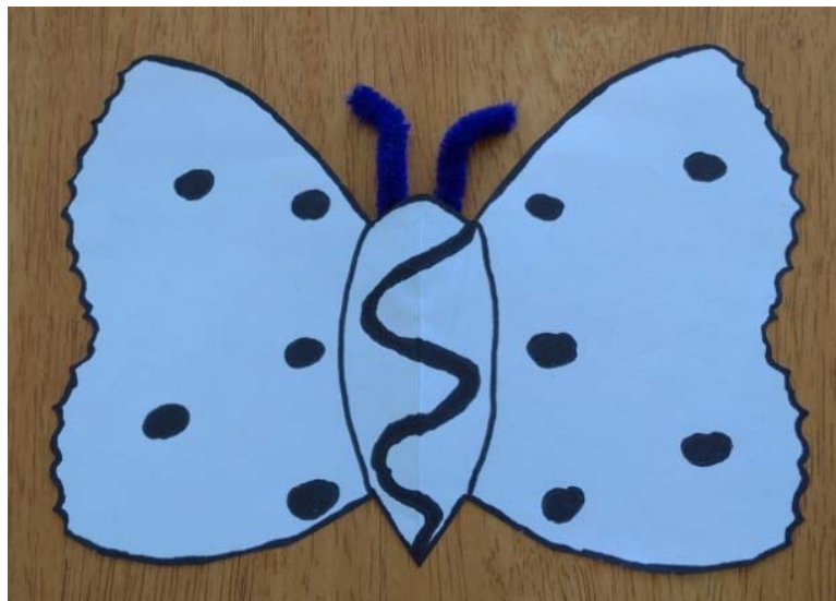
PRIMOŽ PELKO, 7. B