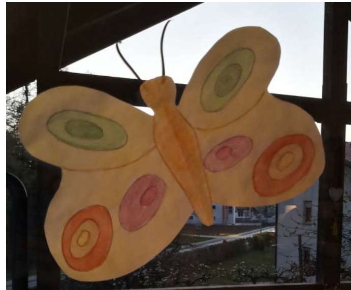
TEVŽ BERTONCELJ, 7. B