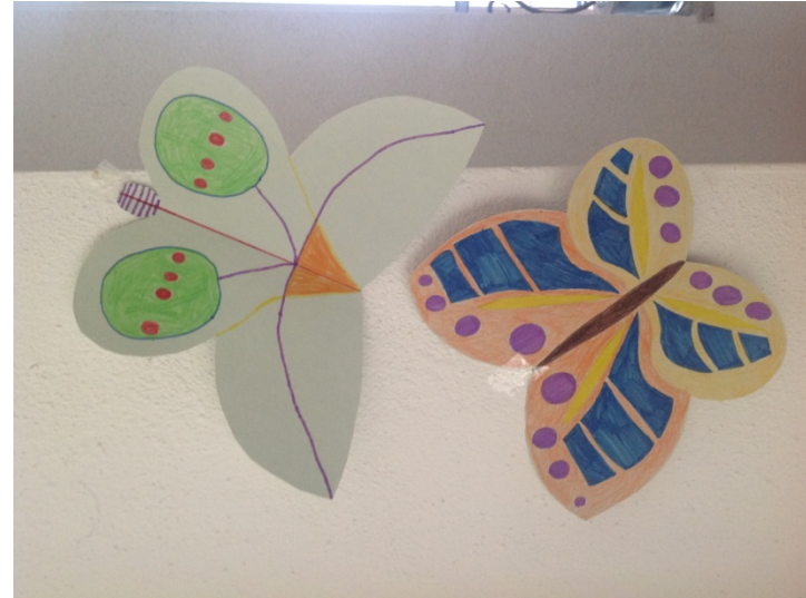
STIAN IN STELAN FELDIN, 7. B