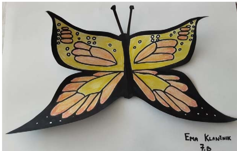
EMA KLANČNIK, 7. B