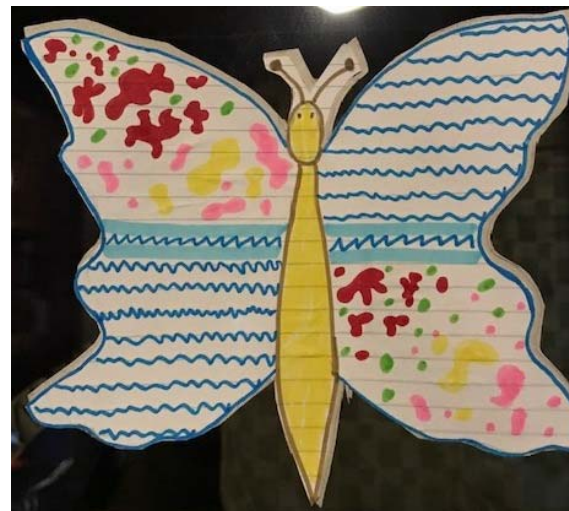
AMANDA CELIK, 7. B