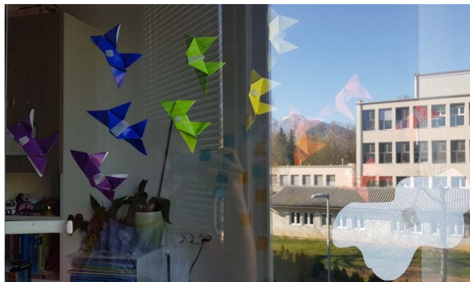
LUCIJA KOVAČIČ, 7. B