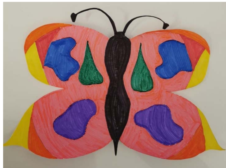
IVAN ČOLIČ, 7. B